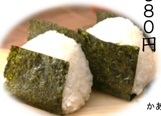
かあさんおにぎり