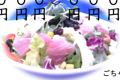
ごちやまぜサラダ