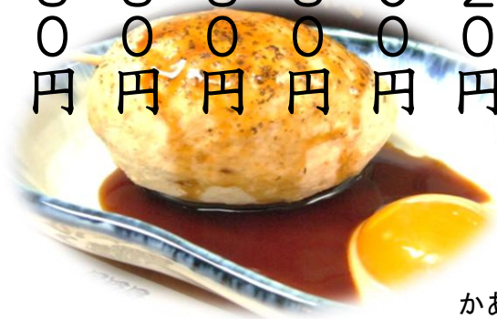
かあさん魔女つくね